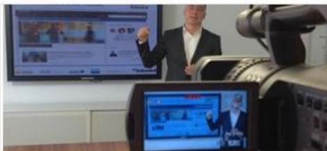
Videosesión sobre Marketing en Internet: Exportación 2.0

Especialidades: Integrated marketing communications, digital marketing, business development, marketing outsourcing, project management, applied innovation, digital consumer, business 2.0, future trends