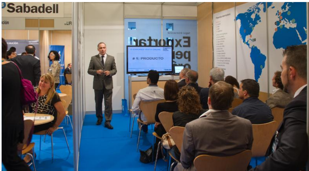
Imagen c: Un buen vídeo, fotografía o artículo de conclusiones nos sirve para reforzar a nuestro público objetivo nuestro posicionamiento como expertos