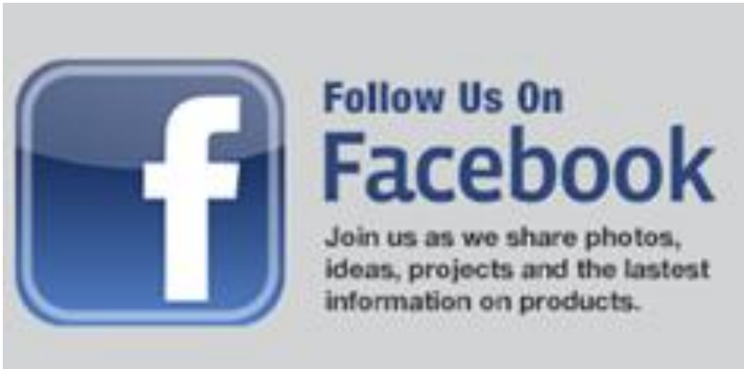
Imagen b: debemos anunciar en el stand campañas de captación de seguidores para nuestro perfil de empresa en LinkedIn o nuestra página en Facebook, Twitter, YouTube, etc.