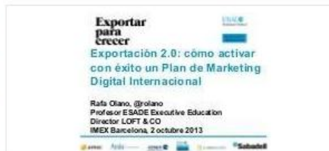
Taller EXPORTACIÓN 2.0 en IMEX Rafa Olano 02102013

Imagen a: LinkedIn nos permite actualizar nuestro perfil personal con PowerPoints donde, en el idioma correspondiente, anunciaremos los productos y presentación específicas para la feria