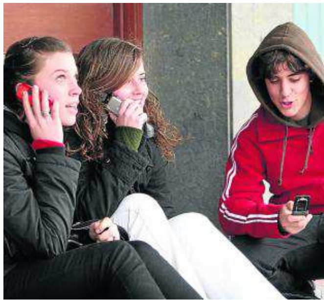
En total, 11 compañías participan en las subastas.

Esfuerzo por parte de los negociadores del Ministerio de Industria que, entre bambalinas y en paralelo a la mesa de contratación, tendrán que convencer a las 11 operadoras que pujan por las nuevas frecuencias móviles puestas en el mercado de las bondades económicas que éstas les pueden ofrecer a medio y largo plazo. Aque-